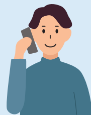
電話サービス& BBIQ契約者

*現在ご利用中の電話サービスの契約者名義で手続きができない場合は、候補名義者にて移転手続きを行います。