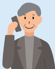
ご利用中電話サービスの 契約者名義者